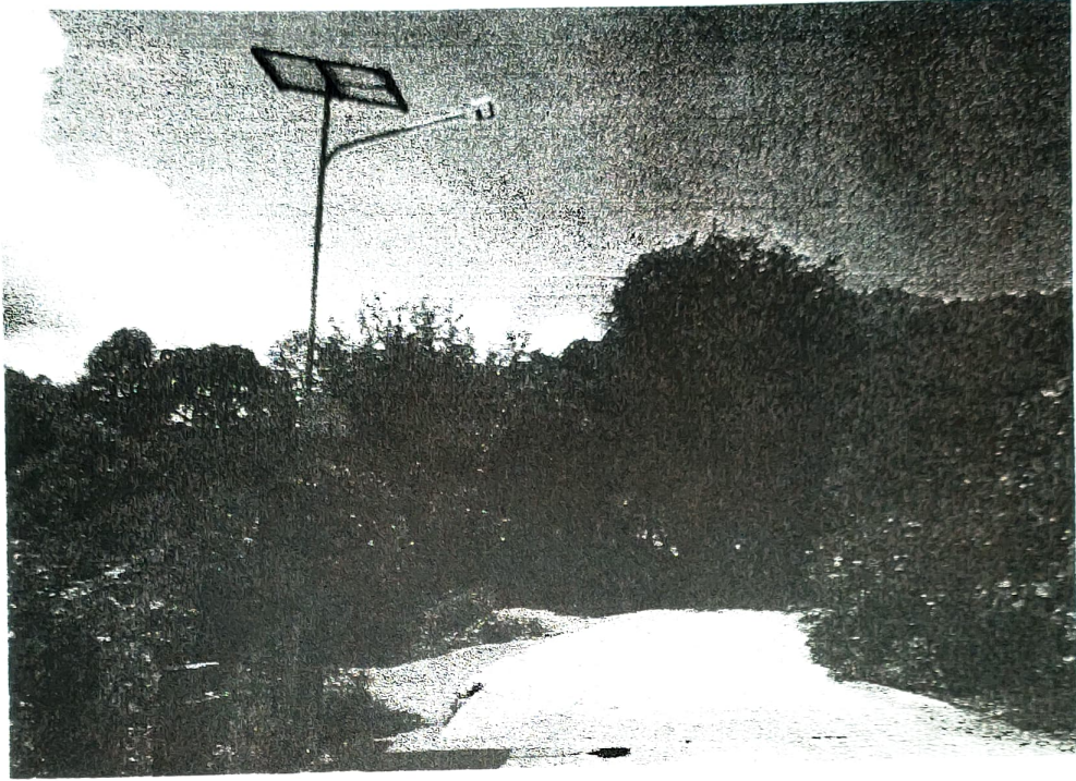
จุดที่ 2 บริเวณถนนภายในหมู่บ้าน